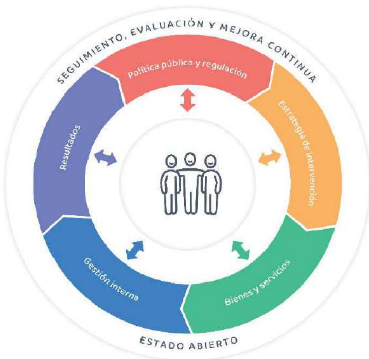
Gráfico N° 2: Modelo conceptual de la PNMGP al 2030

En el marco del paradigma de la nueva gobernanza, la PNMGP al 2030 plantea un modelo conceptual basado en la lógica de la cadena de valor público, el cual facilita contar con una aproximación holística para comprender las decisiones de política y estrategias de intervención que se adoptan desde el Estado para resolver un determinado problema público; el funcionamiento de las entidades públicas (en términos de su gestión interna), los productos que generan (en términos de los bienes, servicios y regulaciones) y los resultados que permitirán generar los cambios esperados en el bienestar de las personas y de la sociedad. Del mismo modo, a través de dicho enfoque, se busca transmitir que las intervenciones públicas en el territorio no son solo el resultado del rol preponderante que asume una entidad pública, sino que resulta – sobre todo – de los distintos procesos de gobernanza que se establezcan entre entidades públicas, organizaciones del sector privado y las personas (PNUD, 2015). Véase gráfico N° 2: